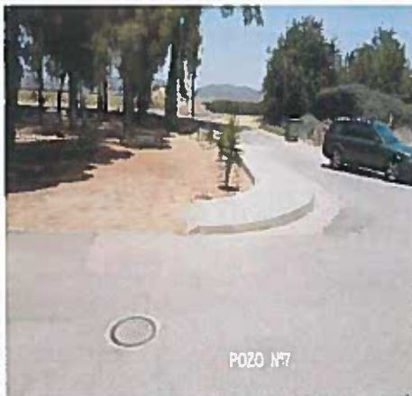
CALLE LOS ZAMORALES 27º41'31" N 5º 26'11" W