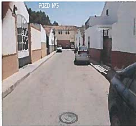
CALLE LA MATILLA 37º41'24" N 5º 26'30" W