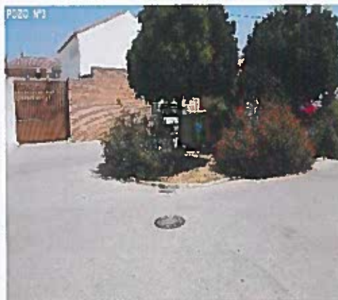
CALLE LA VEGA