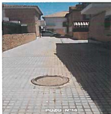
CALLE LOS FRESNOS