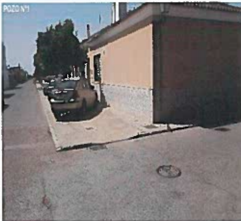
CALLE PRINCIPE DE ASTURIAS