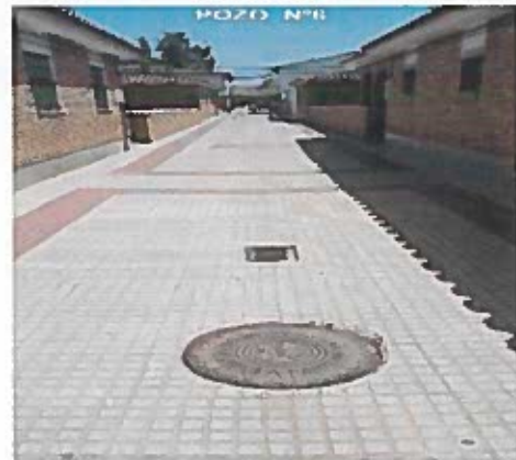
CALLE CARRETERAS 37º41'23" N 5º 26'31" W