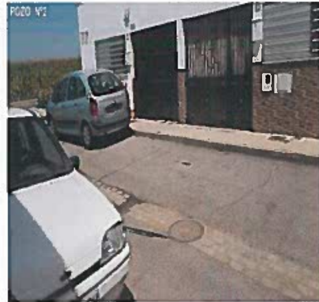
CALLE SAN ISIDRO LABRADOR