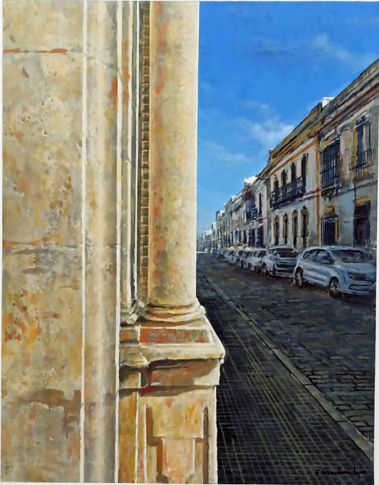
5º Premio: Emiliano Vozmediano